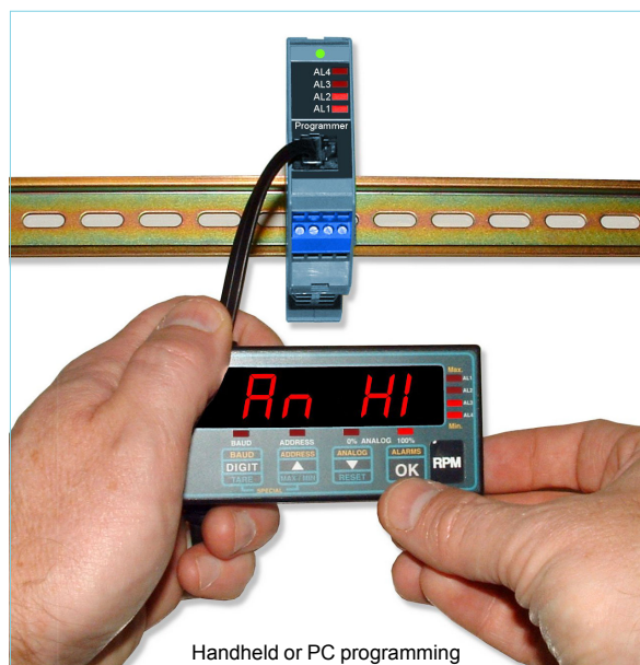
Handheld or PC programming